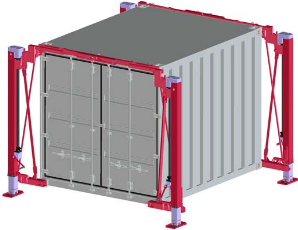
Abb. zeigt zeigt einschiebbare Ausführung mit manuellem Antrieb / fig. shows option ‚Retractable‘ with manual drive / fig. option « Rétractable » avec entrainement manuel

Dispositif de levage 12 t rétractable, type 2689.12